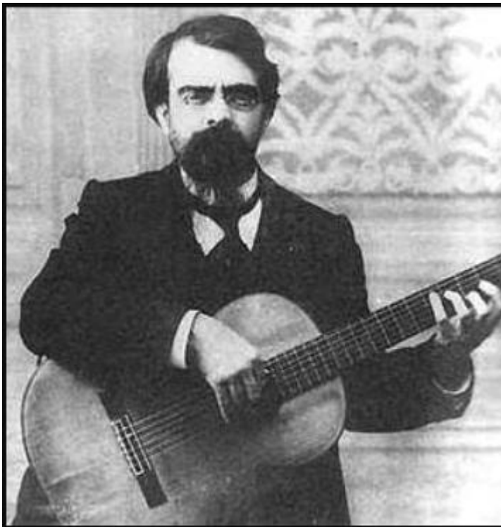
Antonio de Torres Jurado, Almería, ca. 1870

Su sistema de barrado en abanico de siete varetas permitió una respuesta más equilibrada entre graves y agudos, mayor volumen y un timbre claro y profundo. Con Torres nace la guitarra española moderna , base de todos los modelos posteriores.