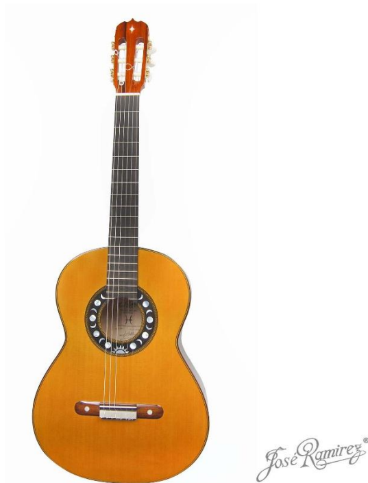
Guitarra José Ramírez, Madrid, siglo XX

como Andrés Segovia , que impulsaron su repertorio y su presencia en las salas de concierto. En la actualidad, la investigación acústica, los materiales modernos y la experimentación (como el