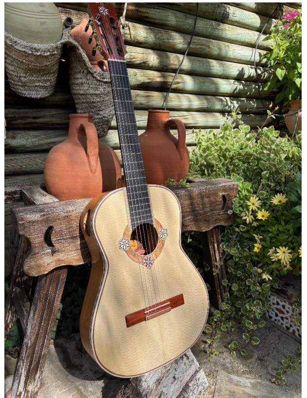
Guitarra la Granaina. Magin , siglo XX

uso de fibra de carbono o dobles fondos) continúan ampliando sus posibilidades sonoras sin perder su esencia tradicional.