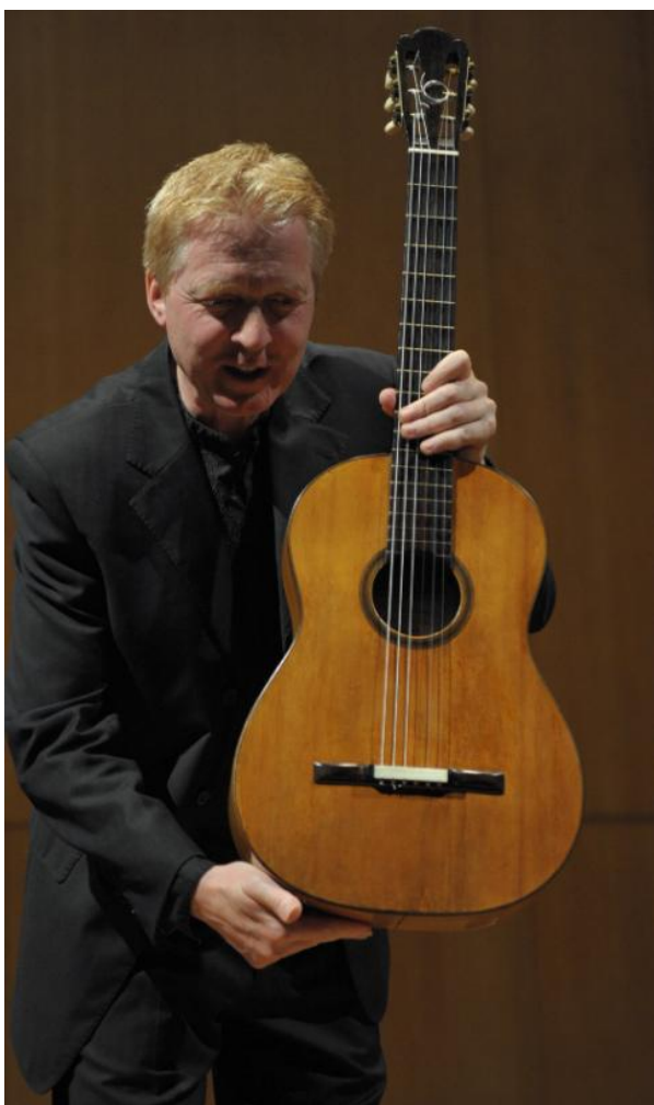
“La Leona”, 1856, considerada la primera guitarra moderna.